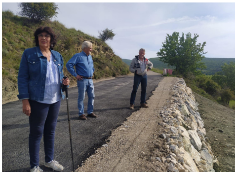
Hameau de bouiron