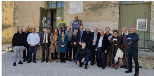
Journée de rencontre autour de la MHeMO