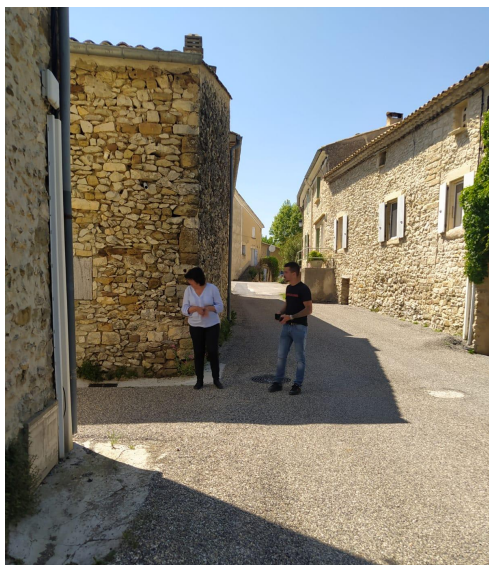
rue de la rochelle

En 2016, une dégradation de la qualité de l'eau de la source du Riou (présence de 2,6 D en concentration moindre que sur le pompage), a conduit à suspendre son utilisation. Par conséquent, la commune est à ce jour alimentée uniquement par le SMAEP, et doit acheter la totalité de sa consommation.