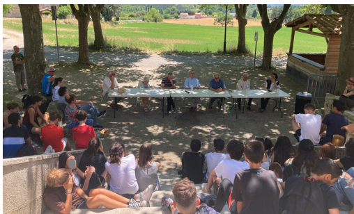
Journée pédagogique de la MHeMO/collège de Sisteron