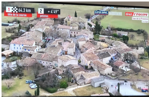
Image TV d'Ongles avec commentaires diffusés en direct pendant la course.