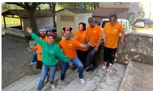
Trail de Haute Provence : le film 2022

https://www.youtube.com/watch?v=eq81H5cmhQQ