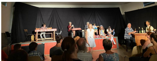
Pièce de théâtre "Au café de la gare" au foyer

https://www.youtube.com/watch?v=eq81H5cmhQQ